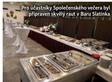
Pro účastníky Společenského večera byl připraven skvělý raut v Baru Slatinka