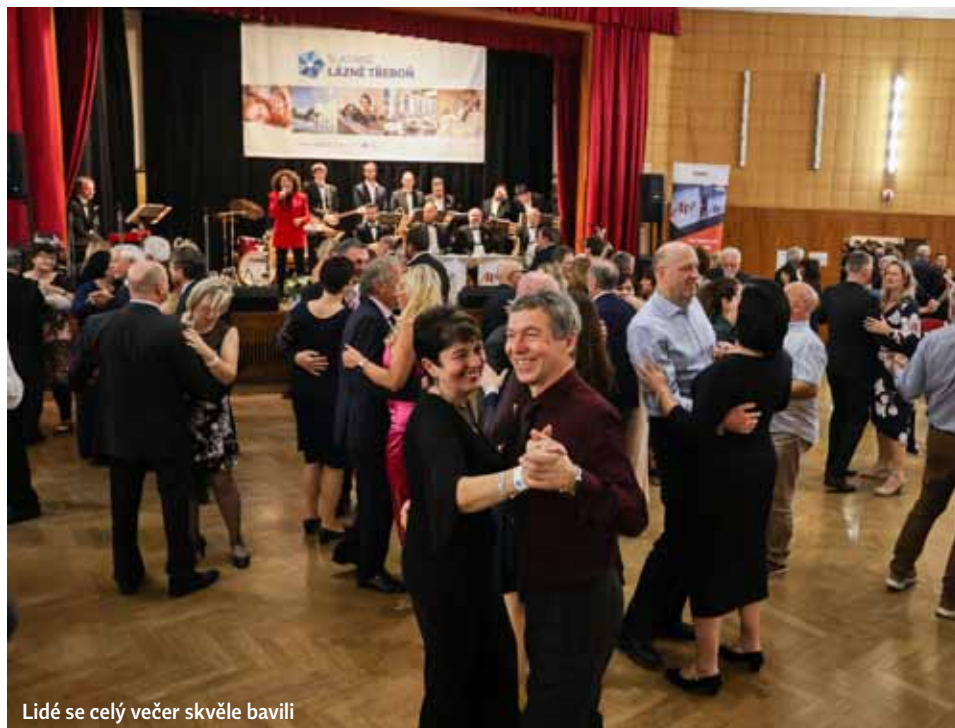
Lidé se celý večer skvěle bavili