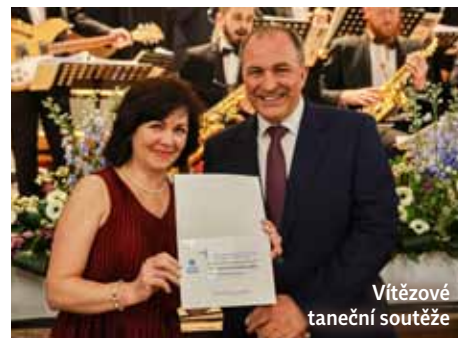
Vítězové taneční soutěže