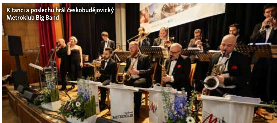
K tanci a poslechu hrál českobudějovický Metroklub Big Band

Oficiálně první Společenský večer pořádaný našimi lázněmi potvrdil, že za kvalitní zábavou a dobrým jídlem rádi vyrazí naši klienti i široká veřejnost. Jsem rád, že díky dispozicím Společenského sálu v Lázeňském domě Aurora můžeme pořádat i večer s hudbou a tancem. Před rokem proběhl pomyslný nultý ročník a na základě pozitivních zpětných vazeb jsme se v rámci vedení lázní rozhodli, že Společenský večer zařadíme pevně do kulturního programu lázní. Zvýšený zájem o vstupenky na letošní, oficiálně první ročník potvrdil, že se jednalo o krok správným směrem. K naplnění motta Slatinných lázní Třeboň, které slibuje pohazení pro tělo i pro duši, je kromě kvalitní léčebné péče potřebný i rozmanitý kulturní program, kde společenská událost ve formátu ple-su nemůže chybět.